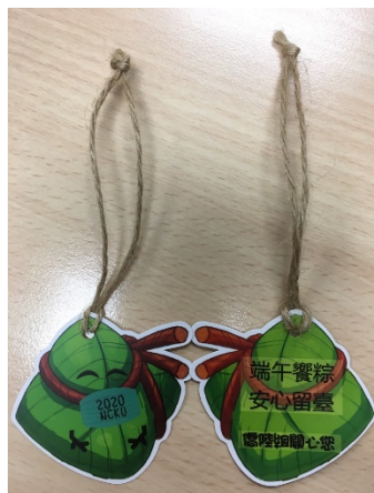
精心製作的可愛粽型書籤