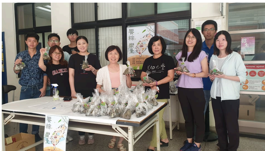
領粽同學與僑陸組師長合影